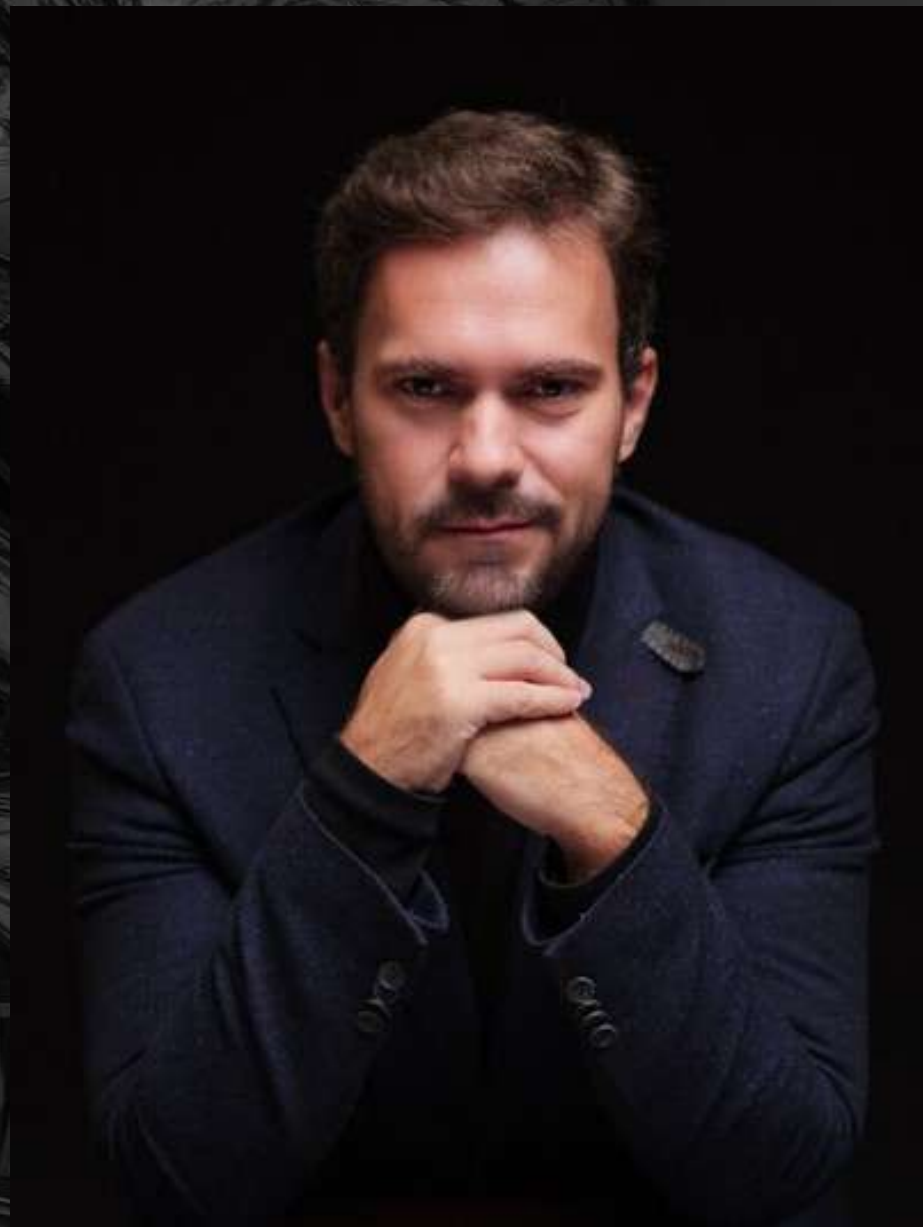
Florín Estefan Director general de La Ópera Nacional de Rumanía